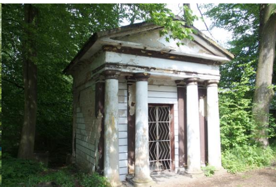
Zdjęcie nr 12. Łazienka w zespole