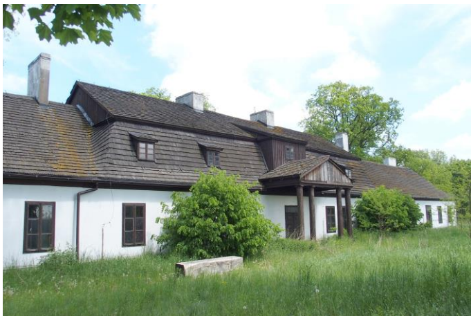
Zdjęcie nr 10. Staropolski dworek, ul. Parkowa 2, Lipie