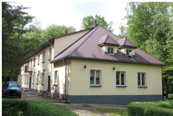
Zdjęcie nr 11. Oficyna w zespole