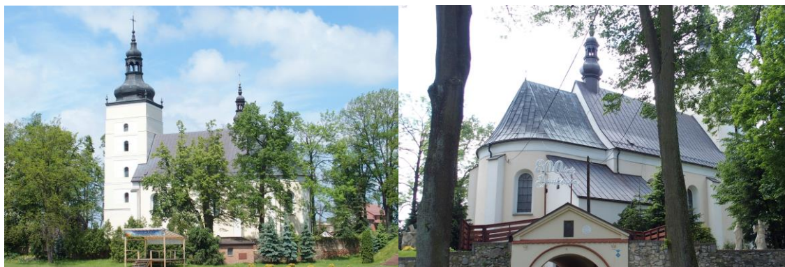
Zdjęcie nr 1, 2. Kościół parafialny pw. św. Stanisława Biskupa Męczennika, Danków