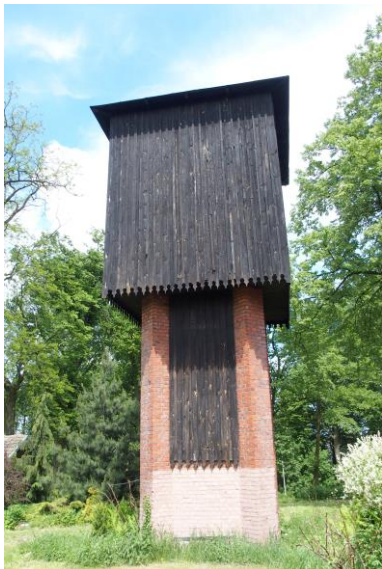
Zdjęcie nr 15. Wieża wodociągowa w zespole dworsko - parkowym, ul. Parkowa 1a, Lipie

Wieża wodociągowa w zespole dworsko - parkowym, ul. Parkowa 1a, Lipie, XIX w.