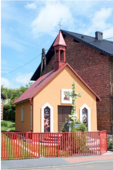
Zdjęcie 4. Kaplica Dziewicza Św. Jana w Lipiu, ul. Częstochowska, k. nr 114

Kaplica została zbudowana w 1 poł. XVIII w., po epidemii cholery. W czerwcu odprawiane są odpusty, na których stoi dużo straganów z zabawkami. Kapliczka kubaturowa nakryta dwuspadowym dachem z sygnaturką. W fasadzie prostokątne drzwi zwieńczone płyciną z obrazem Madonny. Po bokach para okien zamkniętych trójkątnie. Wnęki w szerokich opaskach.