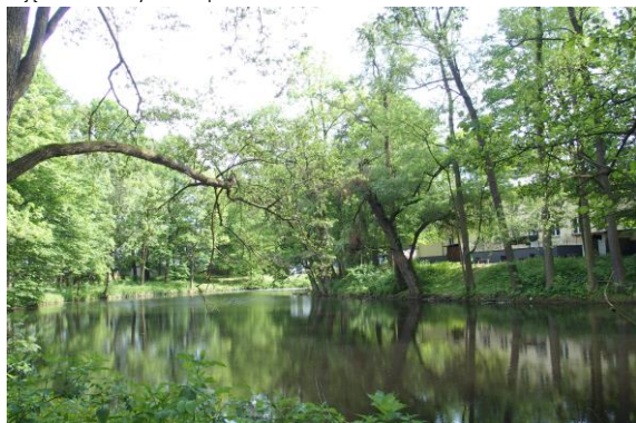
Zdjęcie nr 13. Park w zespole