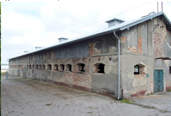
Zdjęcie nr 14. Budynek gospodarczy w zespole

Zespół usytuowany jest w środkowej części wsi, założony w końcu XVIII w., na przełomie XIX/XX w. poszerzony do powierzchni 11,6 ha. Ma kształt wieloboku wydłużonego z pód. - wsch. na półn. - zach. Obejmował park w stylu angielskim i pałac. Pałac Potockich z pocz. XX w. został zniszczony w czasie II wojny światowej i rozebrany w latach powojennych. Główne wejście na jego teren znajduje się przy pód. granicy. W jego obrębie widać pozostałości starych budynków, jak i nowo wybudowane pawilony lecznicze (obecnie znajduje się tu Ośrodek Terapii Uzależnień od Alkoholu). Część zach. stanowi kompozycja starodrzewu i współczesnych nasadzeń z częściowo zachowanym układem alejek spacerowych. Droga od wejścia prowadzi wprost do oficyny pałacowej, położonej w półn. części parku. Po obu jej stronach znajdują się współcześnie wybudowane budynki. Na miejscu pałacu Potockich obecnie stoi pawilon leczniczy. Przed tym budynkiem zachował się pierwotny układ alejek i nasadzeń zieleni, który jest pozostałością podjazdu do pałacu za czasów jego świetności. Podobny plac znajduje się przed oficyną pałacową. Poza tym w parku znajdują się dwa stawy połączone rowem przepływowym. Większy - „Mieszko”