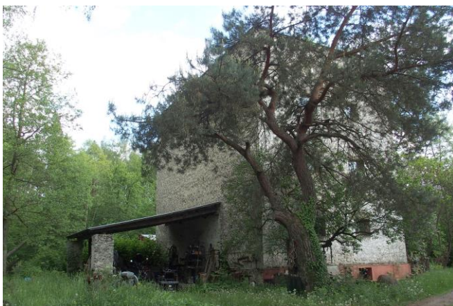
Zdjęcie nr 16. Młyn wodny zwany Regina, Rębielice Szlacheckie nr 121

Młyn wodny zwany Regina, Rębielice Szlacheckie nr 121, XIX/XX w. 2