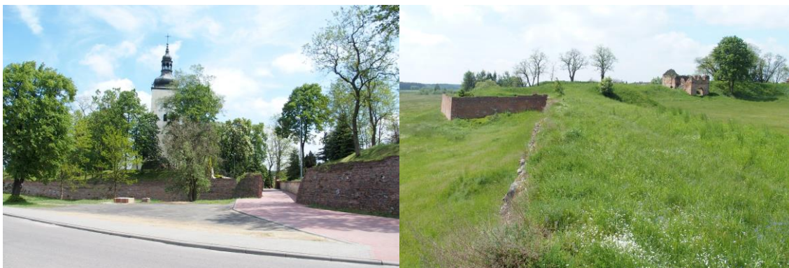
Zdjęcia nr 5, 6, 7, 8. Założenie obronne, Danków

W Dankowie, nad Liswartą na pocz. XV w. powstał zamek. W XVI w. przebudowano go na reprezentacyjno - obronną rezydencję magnacką. W obrębie fortyfikacji powstał również w XVI w. kościół. Kolejne przebudowy zamku, polegające na otoczeniu go fortyfikacjami typu bastionowego, przeprowadził w latach 30. XVII w. Stanisław Warszycki, późniejszy kasztelan krakowski. Ugodowe stanowisko kasztelana w 1655 r. wobec Szwedów obroniła twierdzę przed atakami. Według opisu Ulryka Verdun z 1677 r. zamek był wielki i dobrze zbudowany na brzegu jeziora (w rzeczywistości było do rozlewisko Liswarty), otoczony kamiennymi fortyfikacjami i bastionami w kształcie gwiazdy. Obwarowania znajdowały się zarówno od strony jeziora jak i lądu. Narożne bastiony zostały wzmocnione dodatkowym dziełem fortyfikacyjnym, umieszczone w połowie kurtyny płn. - zach. W trakcie rokoszu Zebrzydowskiego, na początku XVII w., w zamku przebywał król Zygmunt III Waza. W 1756 r. zamek był jeszcze potężną i zamieszkałą warownią magnacką. W ciągu pół wieku stał się opuszczoną ruiną (1823 r.). W 2 poł. XIX w. pleban rozebrał go do fundamentów, by powiększyć powierzchnię ziemi uprawnej.