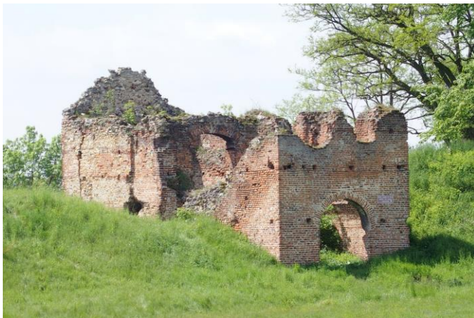
Zdjęcie nr 9. Brama Krzepicka (brama w forcie południowym), Danków

Brama zlokalizowana w kurtynie I-II, zajmuje całą szerokość wału, zbudowana z cegły i kamienia, dwukondygnacyjna, dawniej przykryta dachem dwuspadowym, na rzucie wydłużonego prostokąta z sienią przejazdową, w przyziemiu i pomieszczeniem straży na wyższej kondygnacji. Sień poprzedza od strony wjazdu wyższe od niej, kwadratowe pomieszczenie. W sieni zachowane resztki sklepienia kolebkowego. Zachowane mury zewnętrzne o zróżnicowanej wysokości.