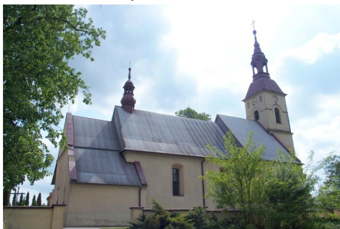
Zdjęcie nr 3. Kościół parafialny pw. św. Piotra i Pawła, ul. Krzepicka 2

Kościół parafialny pw. św. Piotra i Pawła, ul. Krzepicka 2, Parzymiechy, 1460 r., 1750 r., k. XIX w., rekonstrukcja w 1934 r.