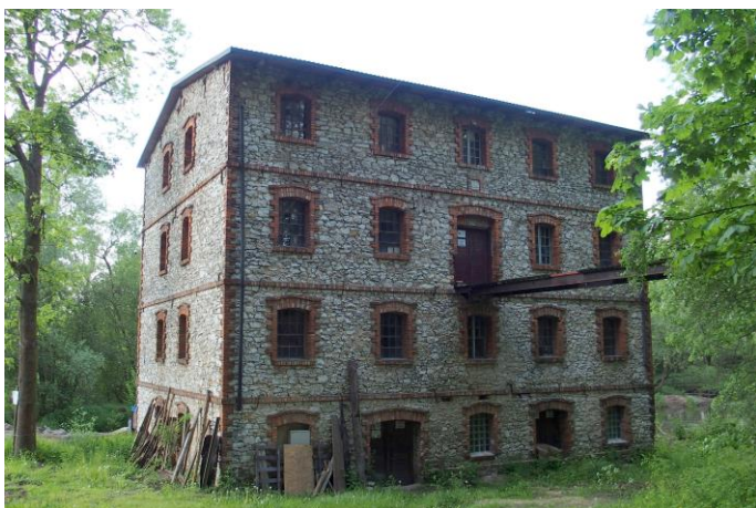
Zdjęcie nr 17. Stary młyn, Troniny

Młyn wodny w Troninach istniał już w 1803 r., jednak zachowany do dziś okazały budynek pochodzi z 1901 r. Trzypiętrowy, kamienny budynek młyna został wzniesiony w roku 1901 r. Jest on zachowany w dobrym stanie. Wcześniej w tym samym miejscu znajdował się młyn drewniany. Początkowo młyn napędzało drewniane koło młyńskie o średnicy ponad 3 metrów. W 1946 r., napęd wodny został wymieniony na turbinę typu Francisa. Obiekt, jako jedyny w okolicy, nie został poddany procesowi nacjonalizacji przemysłu w latach powojennych i do dzisiaj pozostaje w rękach rodziny budowniczego. Budynek nie jest udostępniony dla zwiedzających.