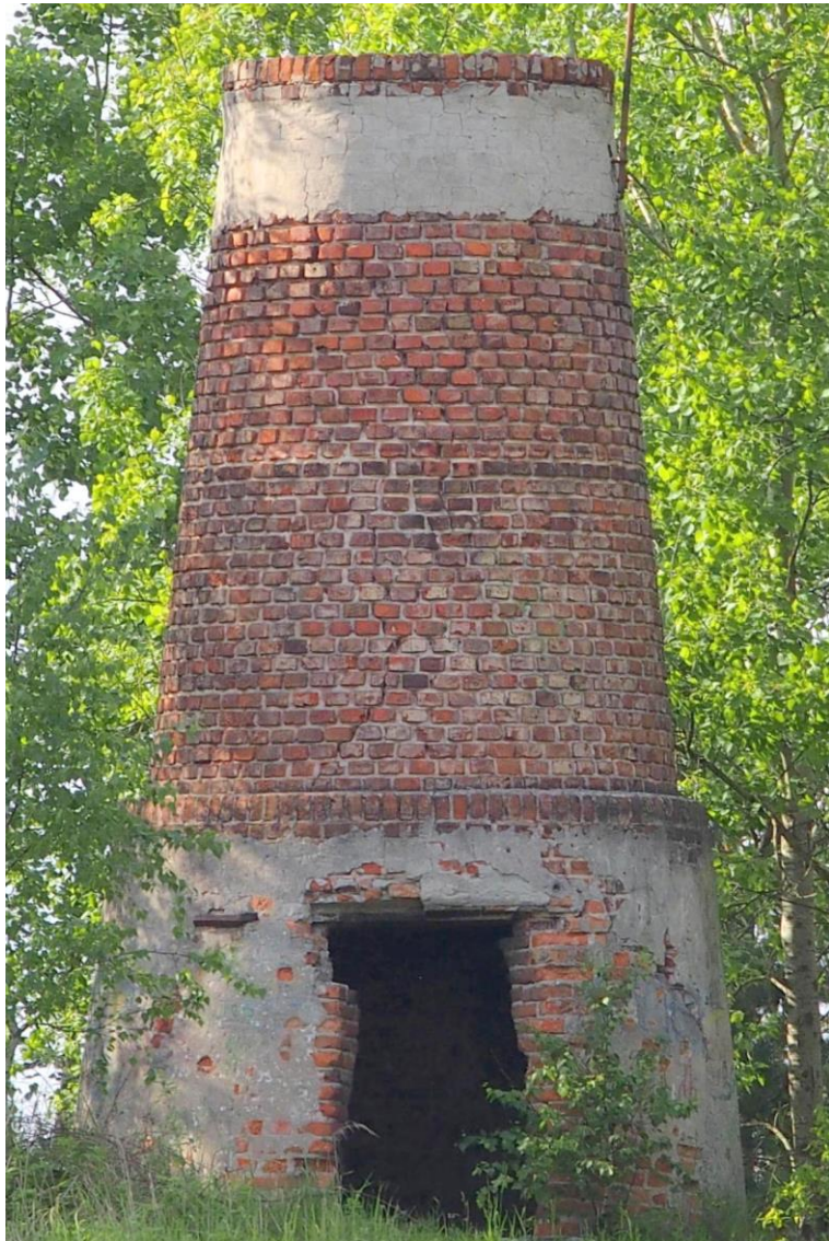
Widok od południa

8. Fotografia z opisem wskazującym orientację albo mapa z zaznaczonym stanowiskiem archeologicznym