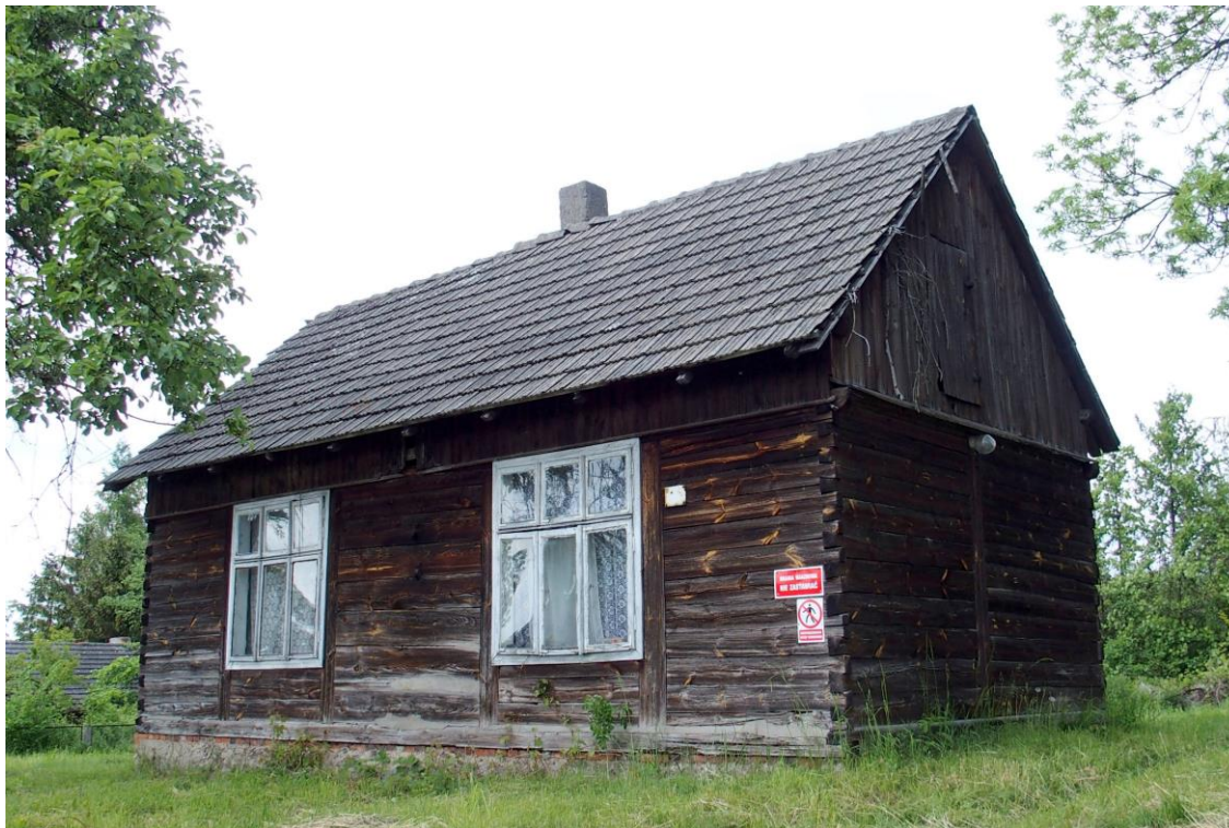
Widok budynku od południa

8. Fotografia z opisem wskazującym orientację albo mapa z zaznaczonym stanowiskiem archeologicznym