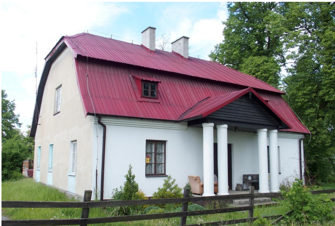
Widok budynku od południa

8. Fotografia z opisem wskazującym orientację albo mapa z zaznaczonym stanowiskiem archeologicznym